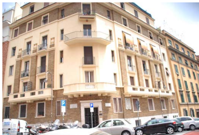
LA NOSTRA SEDE STORICA